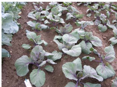
Feldbestand 4 Wochen nach Pflanzung