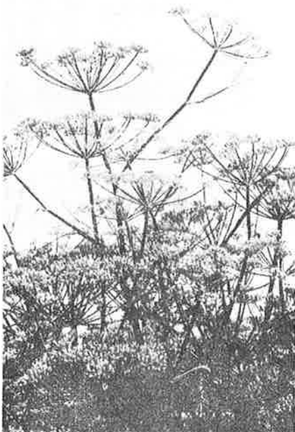
Knollenfenchel 'ZEFA Fino', Samensstände.