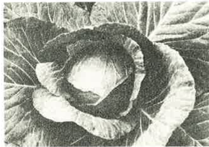
Weisskabis «ZEFA Rapid» mit kurzer Kulturzeit. / Choux blanc «ZÉFA Rapid», avec un temps de culture court.

Samenanbau: Das von der Forschungsanstalt Wädenswil erzeugte Basissaatgut wird im Gürbetal angebaut. Aus diesen Feldern werden die Samenträgerpflanzen ausgelesen. Nach Überwinterung der Strünke erfolgt der Samenanbau im Gürbetal bei Produzenten, die schon früher ihre eigenen «Thurner» Typen vermehrt haben. Die Vermarktung erfolgt wie diejenige des Wädenswiler Kabis über die IG.