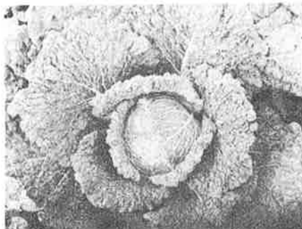
Wirz 'ZEFA Pronto' mit kurzer Kulturzeit. Chou frisé 'ZEFA Pronto'.

Einführung: Nach kurzer Erfolgszeit kam die Sorte im Erwerbsanbau in Vergessenheit. Da sie sich für den Selbstversorgeranbau gut eignet, soll sie vermehrt propagiert werden.